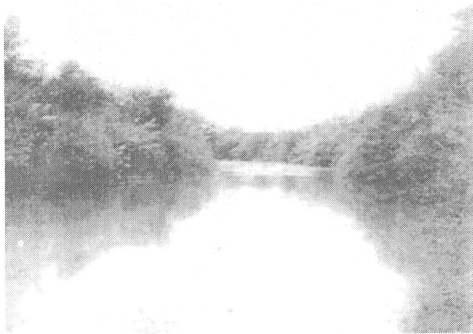
El Río Salado junto a Progreso.